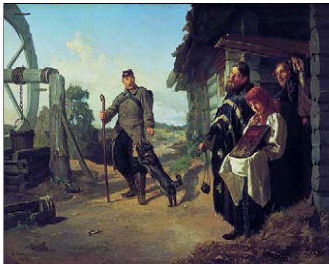
Н. В. Неврев. «Возвращение солдата на родину». 1869 год.

«...сие действие, — продолжает Чулков, — происходит в бывших провинциальных канцеляриях». Провинциальные канцелярии, осуществлявшие общее управление и суд на территории провинциального города и его уезда, были созданы при Петре I в ходе провинциальной реформы 1719 года в