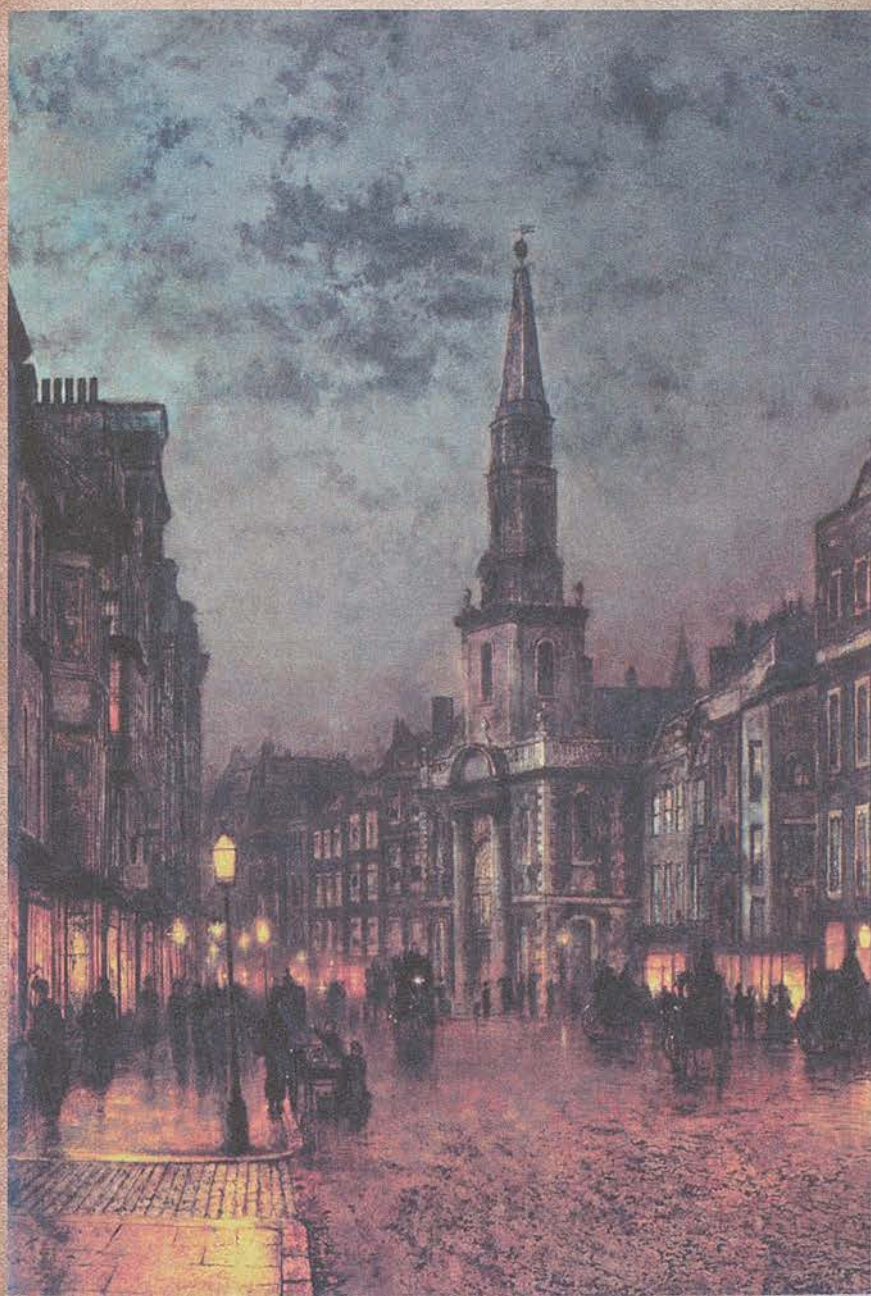
Джон Гримшо. Блэкмен-стрит