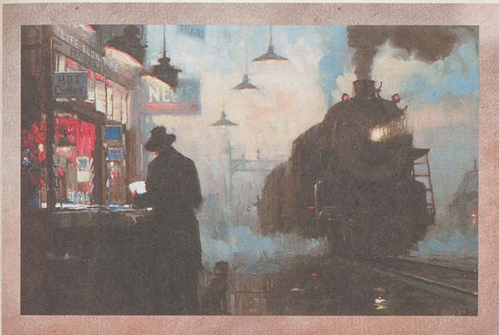
Неизвестный художник. На станции

— Вот так дела! — удивленно заметил я. — Почти все ставят на фаворита в Кембридже. Но, возможно, — добавил я, взглянув на него, — вам это неинтересно?